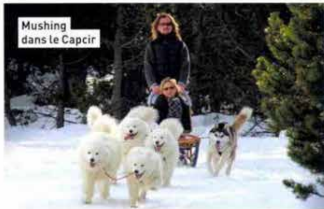
Mushing dans le Capcir