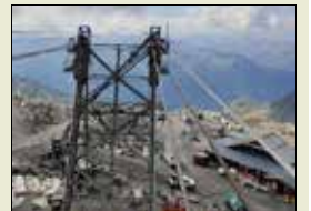
Le chantier hors norme du remplacement des quatre câbles porteurs du téléphérique de la Cime Caron

Depuis janvier, le téléphérique de la Cime Caron est à l'arrêt suite à un incident de fonctionnement : certains des fils qui composent un câble porteur s'étaient effilochés. Afin de permettre la réouverture de cette remontée mythique d'un débit de 1 500 personnes par heure, datant de 1982, c'est une véritable course contre la montre qui s'est engagée pour la société de remontées mécaniques, la Setam, et le constructeur du téléphérique, Poma. Coût de l'opération : 7 M€ pour changer les quatre câbles porteurs de 2 350 mètres et 62 tonnes chacun et effectuer quelques réparations annexes dont le changement de toutes les armoires électriques de commande et de puissance, l'installation de fibres optiques sur deux des quatre câbles afin d'améliorer la transmission d'information sur le fonctionnement du téléphérique et le passage en moteur de traction asynchrone en lieu et place du moteur de