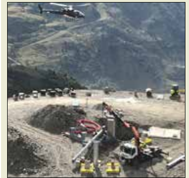
Le point culminant du domaine Galibier-Thabor est porté de 2 594 à 2 750 m.

Avec le nouveau télésiège débrayable six places de la Sandoire et ses deux pistes rouges (extension en site vierge et en altitude), le domaine skiable Galibier-Thabor va monter à 2 750 m d'altitude, avec 14 hectares supplémentaires. Des pistes rouges sont prévues pour respecter les écoulements naturels et limiter les impacts paysagers. Le chantier est accompagné de la mise en place d'un observatoire environnemental. Ces travaux de 8,6 M€ sont rendus possibles par la bonne santé financière de la Semval. Un gain d'altitude qui, outre un panorama différent, offre la perspective d'un gros dénivelé jusqu'à Valmeinier villages (1 430 m), grâce aux deux nouvelles pistes rouges, Carline et Moraine, et surtout un enneigement naturel, en altitude, qui garantit les ailes de saison et sécurise le produit pour l'avenir.