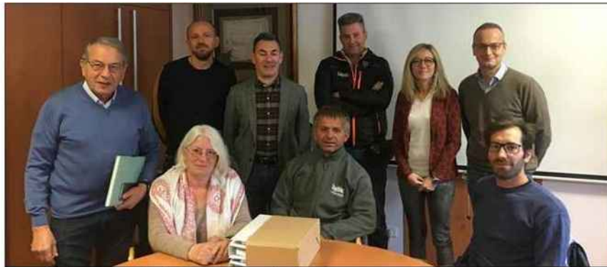
Le comité de station se réunit désormais un vendredi sur deux.

Dix acteurs de la commune vont désormais se retrouver toutes les deux semaines, pour une réunion d'une heure destinée avant tout à échanger des informations sur les activités à venir ou en cours de préparation. Sans empiéter sur les domaines de compétences des uns et des autres, les participants échangeront conseils et avis. Le tout, en évitant les doublons et télécopages de calendriers, entre les activités programmées par