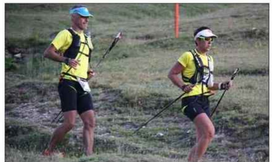
Le grand Trail du Galibier-Thabor a réuni 22 binômes, qui ont bivouaqué au camp des Rochilles.