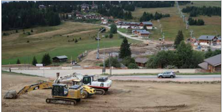
Le but de ces travaux : mieux répartir le flux des skieurs et éviter la saturation d'autres télésièges.

À l'entrée des Saisies, côté Beaufortain, le télésiège de la Légette a disparu, gare de départ comprise. Pour l'instant. Pour sa 20 e année, il s'offre une cure de modernisation (un six places débrayable remplace les quatre places pincées fixes), mais aussi tout un remodelage du secteur : la ligne de la remontée va être rallongée (plus de mille mètres de long pour 320 m de dénivellation) et la gare de départ sera située de l'autre côté de la route départementale.