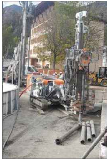
À la fin du mois d'octobre, le chantier battait son plein.

L'objectif : aménager des gradins et une toiture ouverte, pour protéger la piste et ses usagers des aléas de la météo, tout en leur permettant d'admirer le paysage. « Après l'esquisse de plusieurs scénarios par le cabinet d'architecture Laurent Bensac de Lyon, la commune a opté pour une toiture à quatre pans, dynamisée, sur le pan ouest, par deux chiens-assis, qui rompent sa monotonie. La protection de la