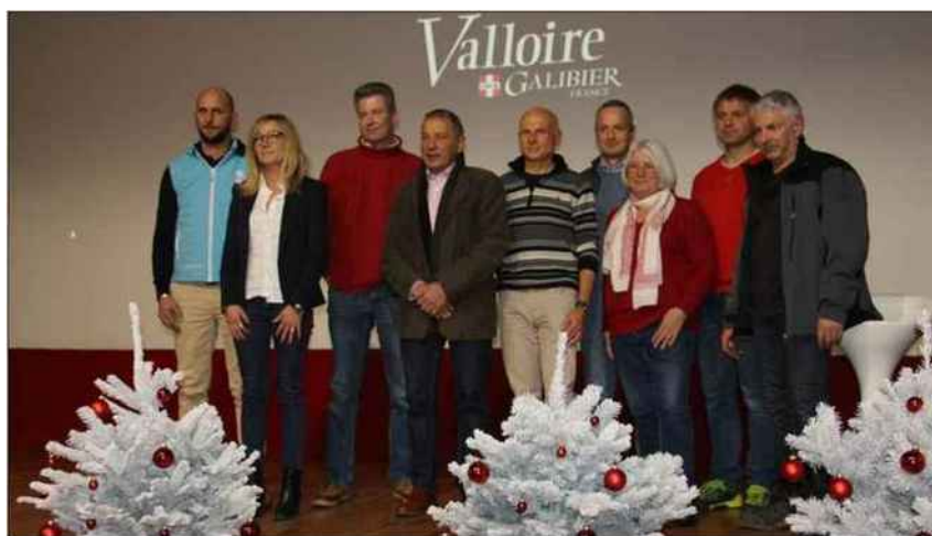
Photo de famille des acteurs de la station.

Les différentes interventions ont montré la complémentarité des professionnels. Pour un hiver réussi, ils apportent, qui leur expérience en matière d'accueil des vacanciers, qui leur passion pour le ski, qui leur dynamisme culturel, qui leur savoir-faire technique. Le tout, sous la houlette d'une