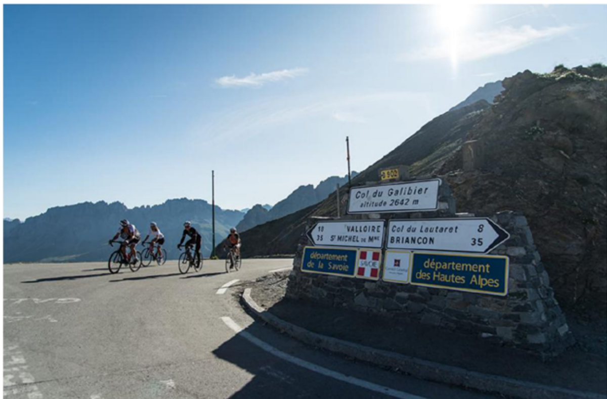
Cyclo col du Galibier

Sur le site web de l'hôtel des Mélézes, un hôtel 3 étoiles situé au pied des pistes dans la station connue des amateurs du Tour de France et de la montée du col du Galibier, c'est du rouge qui s'affiche à l'onglet réservation sur la quasi-totalité des mois de décembre, janvier et février : plus aucune chambre disponible. L'établissement qui ne comprend que 15 chambres n'est pas représentatif de toute la station : là comme ailleurs, quantité de réservations se concluent au dernier moment mais celle-ci rallie de plus en plus d'adeptes au point que le Club Med envisage très sérieusement d'y installer un village. En 2014, la commune et la société d'exploitation des remontées mécaniques ont failli passer sous les fourches caudines de la Cour des Comptes, en raison de sa situation financière mais tout a bien changé. Très bien notée sur tous les sites d'avis clients, la station réussit même l'exploit de devancer les mastodontes que sont Chamonix, Val Thorens, La Plagne sur le taux d'engagement digital, un item mesuré chaque mois dans l'étude We Like Travel. Cet indice mesure l'envie qu'a un client de recommander ou de rester fidèle à un fournisseur, à une marque, après qu'il en fait l'expérience. Il est de plus en plus ausculté, dans l'économie du tourisme comme dans d'autres : tous les secteurs étant désormais très concurrentiels, ce qu'il faut obtenir, c'est la recommandation, la fidélité, clés du repeat business , comme l'expriment les pros du marketing.