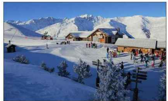
Des équipements de qualité, pour le plus grand confort des clients !

L'autre nouveauté de l'hiver, moyennant 1 million d'euros supplémentaire, est l'installation d'un nouvel espace de vente en plein centre-ville, à deux pas de la billetterie du front de nei-