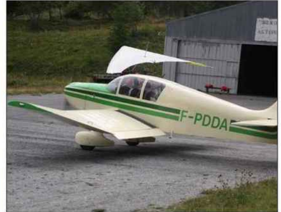
Les pilotes réalisent de nombreux vols d'instruction.