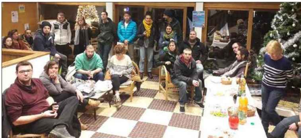
L'AEP a témoigné une fois de plus de sa tradition d'accueil.