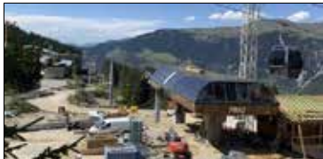
Le chantier hors norme du remplacement des quatre câbles porteurs du téléphérique de la Cime Caron

Pour l'arrivée de cette nouvelle télécabine, tout un front de neige a été réétudié, avec un départ de la piste de luge réaménagé et mieux délimité, une gare d'arrivée du télésiège des Tovets légèrement déplacée pour permettre un flux de skieurs plus clair. Cette télécabine dix places assises a un débit de 2 400 personnes par heure