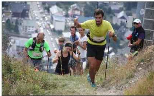
Le Kilomètre Vertical a constitué un superbe prologue.

Le Kilomètre Vertical jusqu'à l'arrivée des télécabines du Crey de la Brive, a tout d'abord constitué une superbe entrée en matière, avec 670 m de dénivellé positif et un effort intense qui a consacré la victoire du