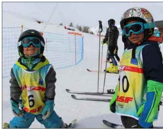
Les enfants arboraient des mines réjouies avant de s'élancer.