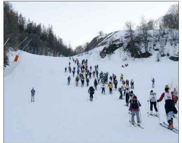
Les sportifs avaient 3,5 kilomètres de montée à affronter. Si certains ont mis 28 minutes et d'autres 1h28, le plaisir était partagé.

S i le domaine de la Sétaz est le rendez-vous incontournable des adeptes du ski de piste, qui y enchaînent les descentes, le ski de randonnée y est aussi à l'honneur. Chaque lundi soir des vacances de février, des montées sèches se déroulent ainsi entre le front de neige de la Sétaz et le plateau de Thimel. Elles at-