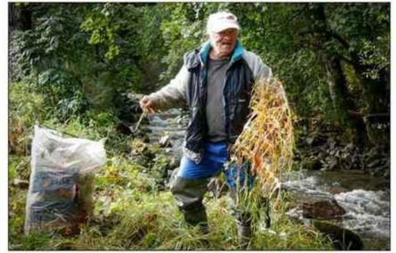
Un filet de chantier, qui n'avait rien à faire dans la Neuvachette, en a été extrait.

La première fois, la quantité et la nature des déchets sortis de l'eau avaient de quoi susciter une prise de conscience salutaire. Les participants avaient retiré, pêle-mêle, des morceaux de plastique, des bouteilles vides, du fil de fer, des bâtons de ski, et même des panneaux publicitaires, des palettes de bois, des sapins de Noël, des géraniums fanés et des bacs à