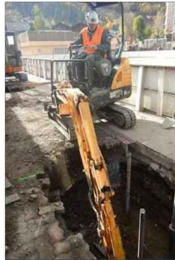
Aménagement des massifs supportant les microfûts.

Fin octobre, le chantier allait bon train, avec la mise en œuvre de massifs en béton reposant sur des micropieux sur lesquels prendront