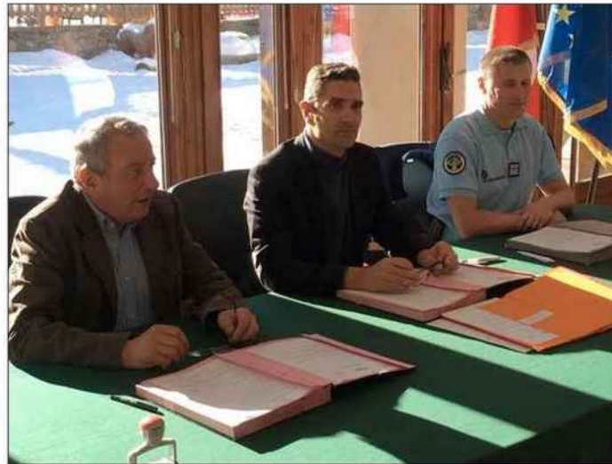
La visite du corps préfectoral a été marquée notamment par la signature d'une convention sécuri-site, une première en Maurienne.

Le corps préfectoral s'est justement rendu avec ses hôtes sur les pistes, pour évoquer le Schéma directeur des remontées mécaniques et le projet du nouveau télésiège débrayable de Montissot, qui devrait remplacer, l'hiver prochain, les anciens télésièges du Colérioux et de Montissot. Les participants ont par ailleurs con-