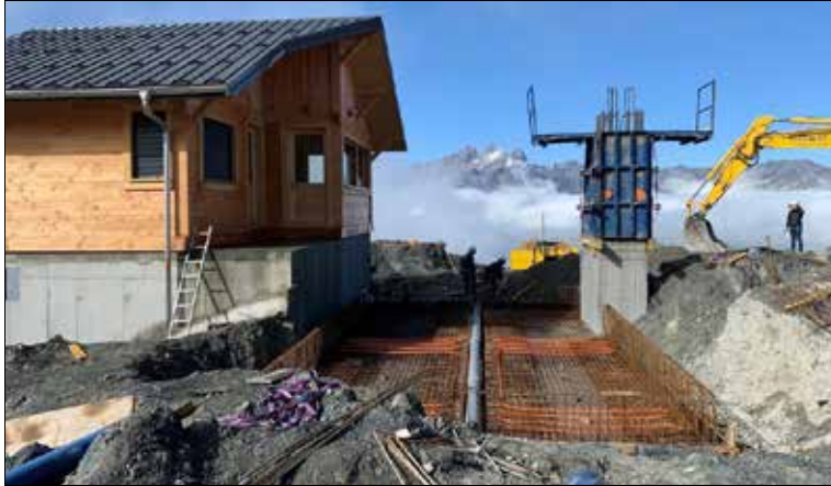
Le télésiège six places de Montissot remplace deux lignes existantes et assure la liaison entre les massifs du Croy du Quart et de la Sétaz.

En remplaçant les deux télésièges de Montissot (un quatre-places datant de 1996) et des Colérioux (trois places de 1982) par un seul appareil, l'exploitant remédie aux problèmes de déséquilibre de fré-