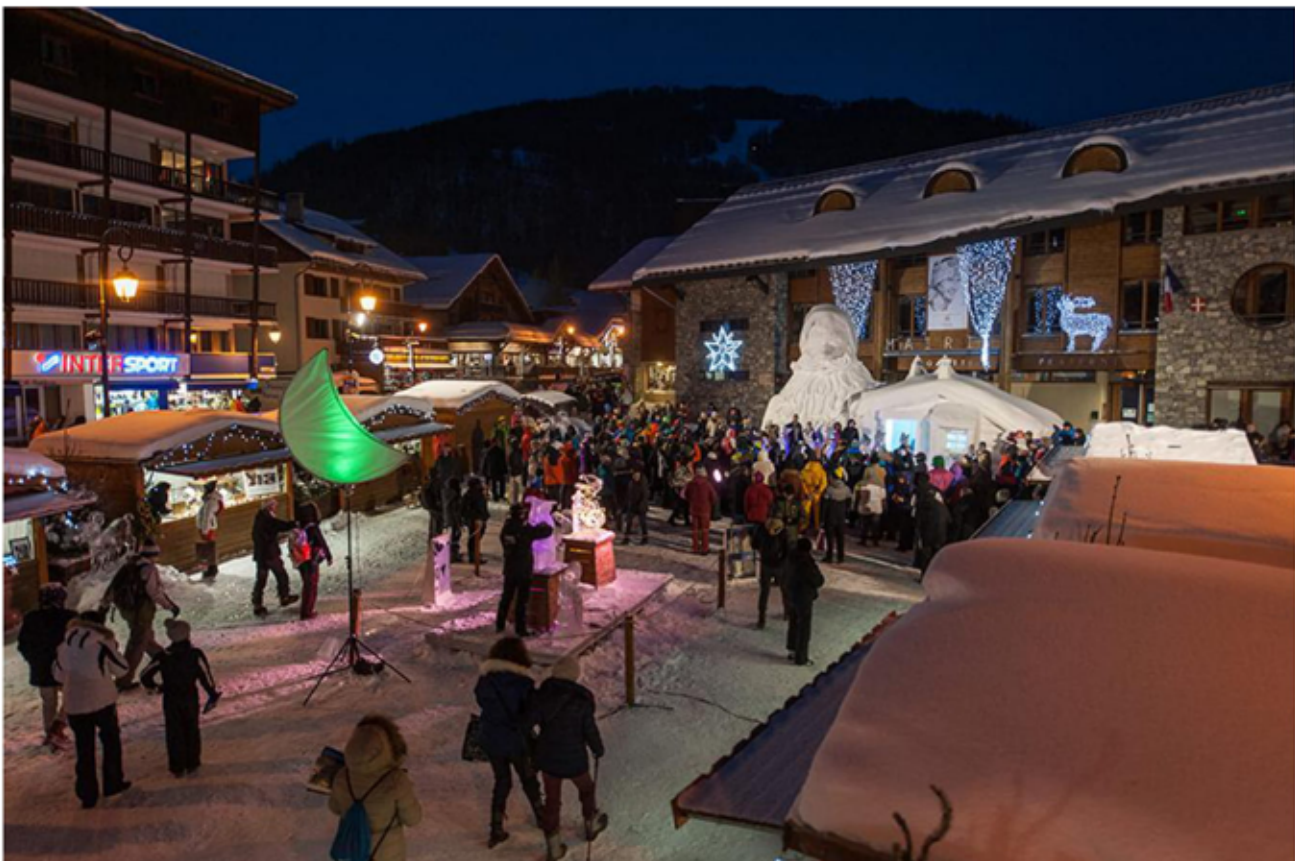
Village famille Noel