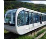
Un design plus moderne.

Depuis 1989, un funiculaire relie Bourg-Saint-Maurice à la station d'Arc 1600 (trois kilomètres de montée pour 800 mètres de dénivellation posif en un peu plus de sept minutes). Après 30 ans de service, les anciennes rames ont été changées cet été. Pour 7 M€, la commune s'est dotée de nouvelles voitures aux lignes rondes et au large vitrage. De quoi permettre d'avoir une vue panoramique à couper le souffle, même si le vitrage fait vite grimper la température en plein été. La capacité du transporteur reste la même : 276 personnes dont une quarantaine de places assises. L'inauguration officielle des nouvelles rames aura lieu le 14 décembre pour la fin des