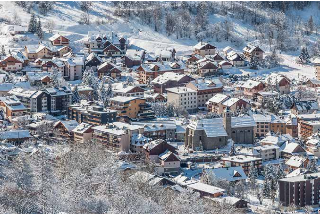
La Valloire

La montagne et les acteurs du tourisme ne sont pas restés à l'écart des travaux sur l'expérience client et vacanciers. Focus sur Valloire, la plus petite des grandes stations, en bonne voie de remporter le critérium de l'expérience montagne et qui a consenti de gros investissements dans cet objectif.