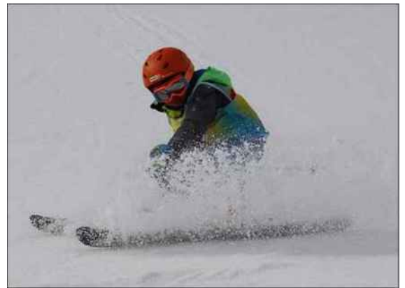
En pleine action, avec une technique déjà sûre...