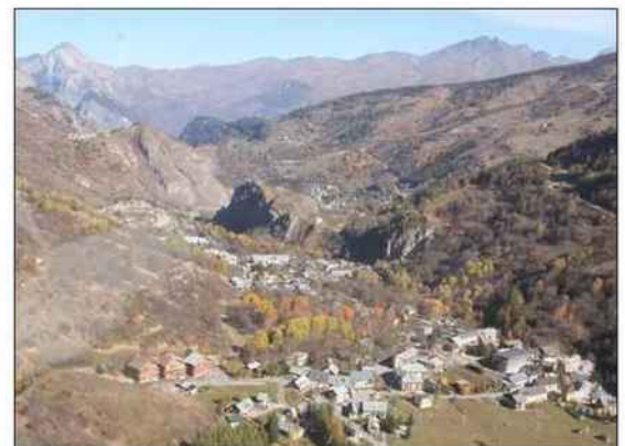
Vu du ciel, le spectacle offert lors des vols découvertes est magique.