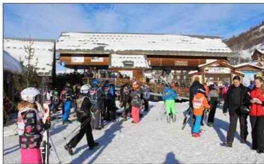
La SEM Valloire a su créer les conditions d'une saison d'hiver 2019-2020 réussie.