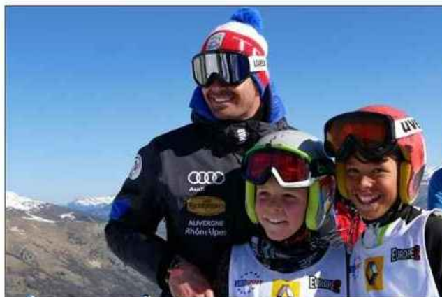
Les graines de champions apprécient de rencontrer leur skieur préféré.

Cette édition 2019 ne sera pas tout à fait comme les autres, puisqu'elle sera marquée par le 10 e anniversaire de l'épreuve. Pour l'occasion, Jean-Baptiste partage-