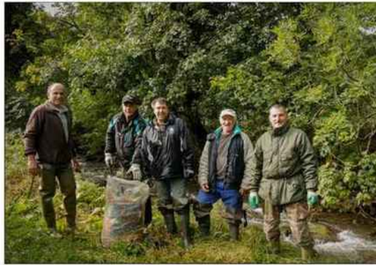
Le travail d'équipe a porté ses fruits.

Avec les employés communaux, l'équipe a finalement comporté sept hommes. C'est la deuxième fois que l'opération est organisée. La première édition, fin octobre 2018, avait aussi impliqué la SEM Valloire, indisponible cette fois-ci. Tous les moyens nécessaires ont été affectés à