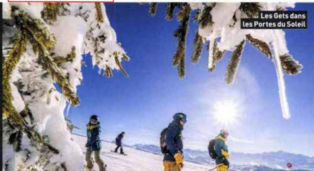
Les Gets dans les Portes du Soleil

Vous rêvez de séjours courts pendant les vacances scolaires. Savoie Mont-Blanc Tourisme a développé une offre Ski M'Arrange avec les tour-opérateurs Maeva, Sunweb, Travelski et SkiPlanet. Exemple : du 22 au 26 décembre à Saint-Sorlin dans la résidence Les Fermes de Saint-Sorlin à partir de 239 €/