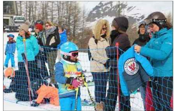
Les parents étaient nombreux à encourager leurs enfants.