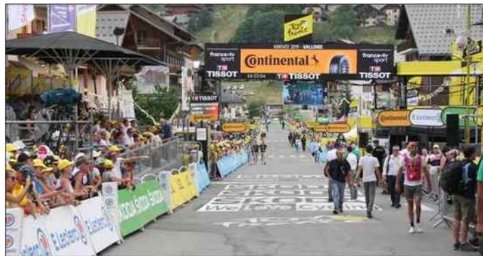
La rue de la Vallée d'Or a pour la première fois été le théâtre d'une arrivée d'étape du Tour de France... Et ce fut une franche réussite !

« Cette étape du Tour de France rappelle que Valloire est une terre de vélo historique et mythique avec le col du Galibier que toutes les courses affectionnent et en particulier le Tour depuis